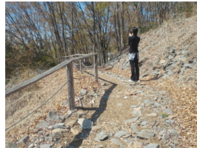
③ 竹中英太郎記念館横が遊歩道入口です