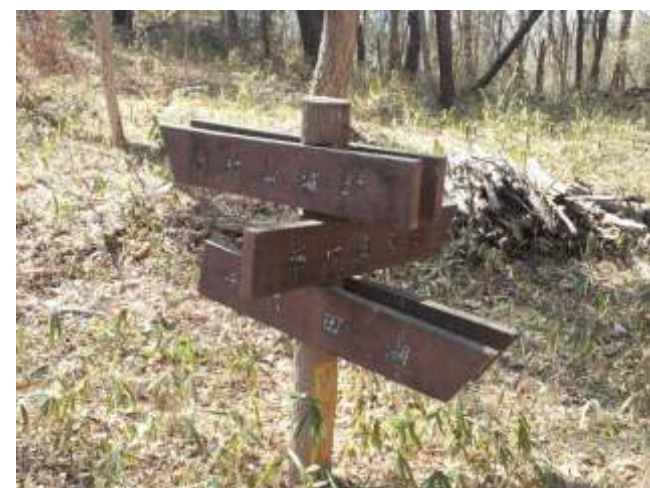
⑳ ぐるりと一周しと先ほどのところへ戻ります