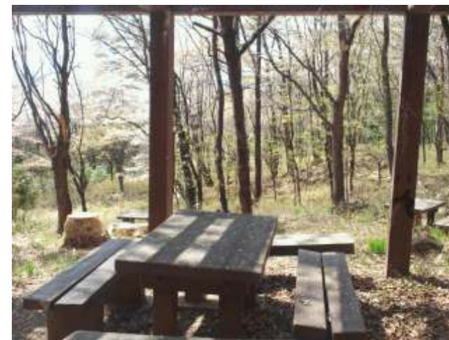
⑦ 地藏古墳では春はお花見が出来ます