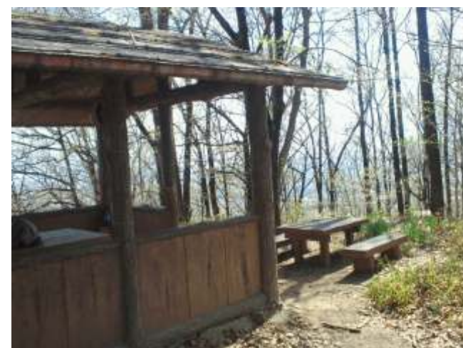
⑯ 山頂の展望台で休憩できます