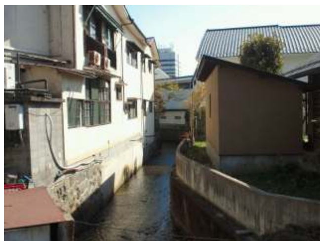
(29)温泉街を流れる湯川