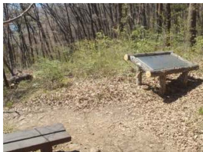
⑩ 南アルプス側の山々が眺望出来ます