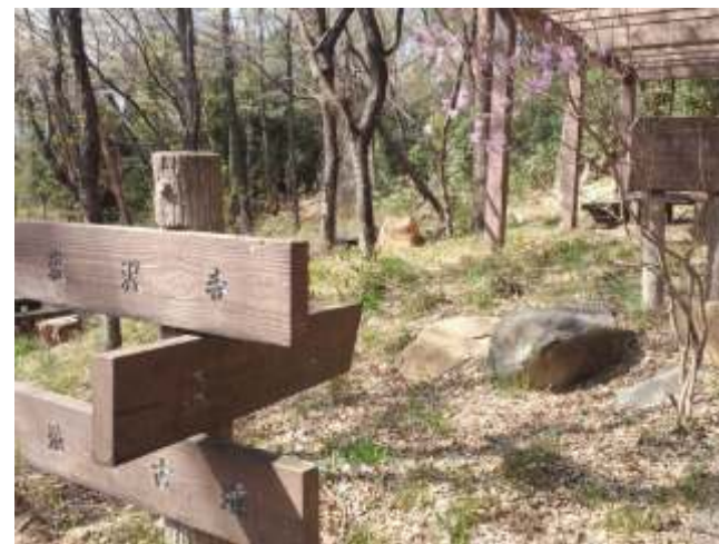
⑥ 最初の急な坂を進むと地藏古墳が見えます