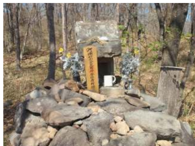
⑲ 湯村山に散歩にくる方を守る金毘羅さん