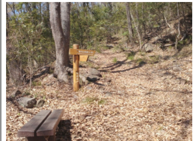
⑧ ここまで来ると坂が緩やかになります