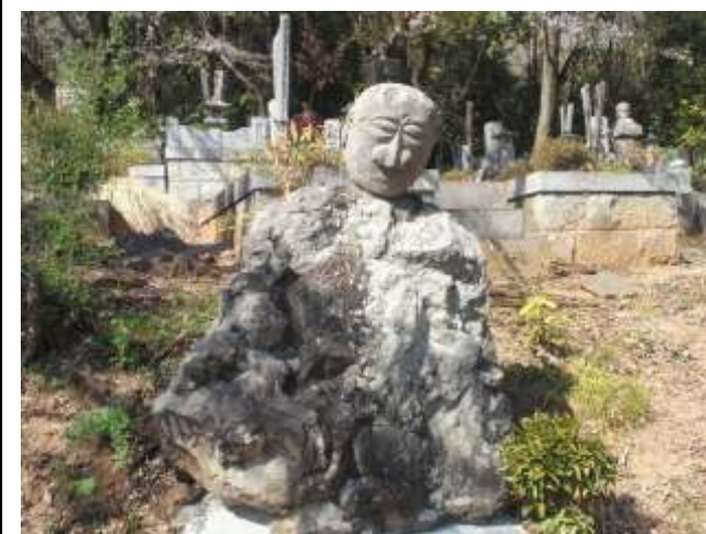
(24)塩澤寺裏にある「たんきりまっちゃん」