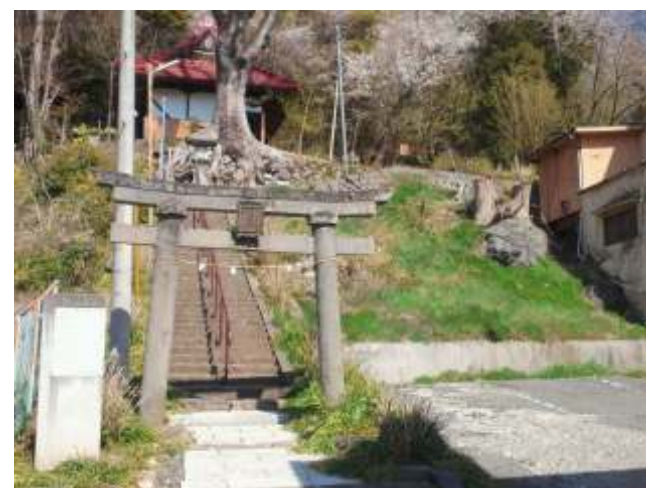
(31)湯権現を祭り湯谷神社の鳥居と石段