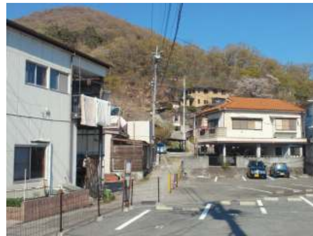
② 菊水さん横を抜け湯村山に向かい進みます