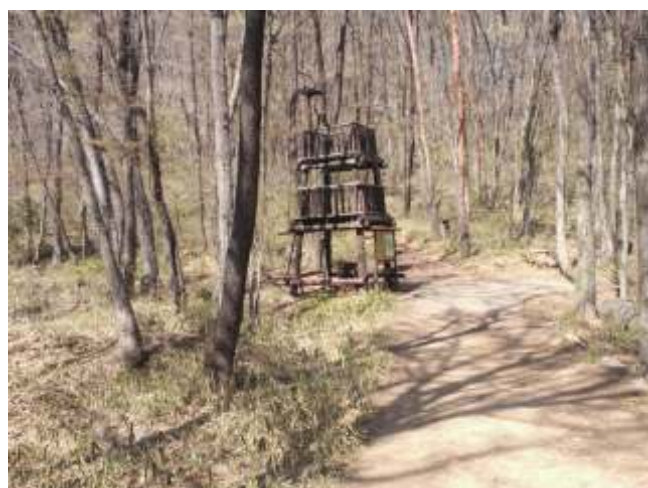
⑬ のろし台の方へまっすぐ進むと千代田湖です