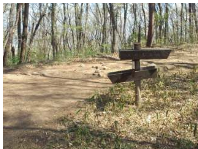
⑪ 山頂迄もうすぐです