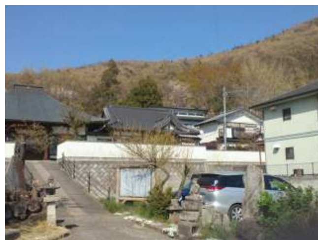
(30)北山観音霊場めぐり一番札所の松元寺