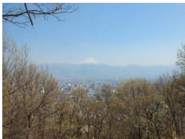
⑰ 山頂から富士山と甲府盆地が一望できます