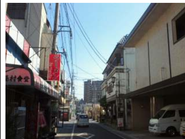
(32)温泉通りを下ると湯村ホテルです