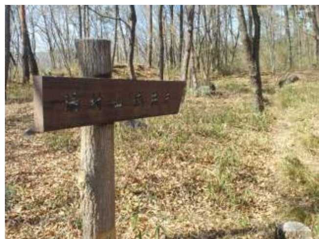
⑱ 山城の名残の枯れない井戸