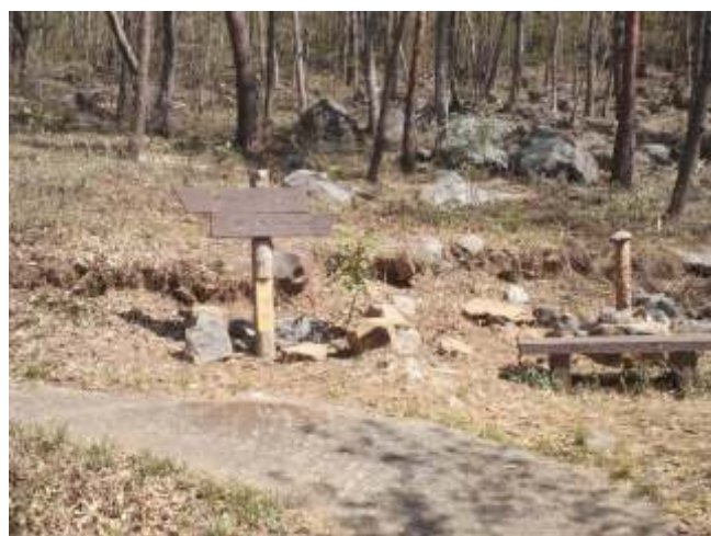
⑨ 途中何カ所かにベンチがあります