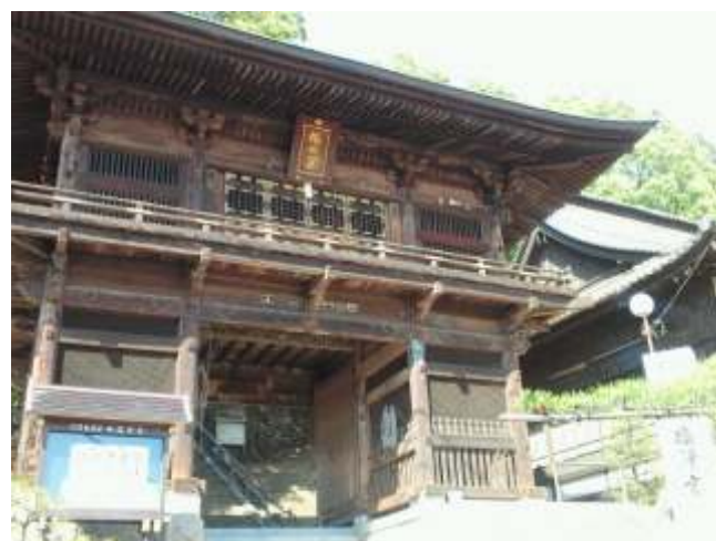
(26)塩澤寺の山門、右手に舞鶴の松があります