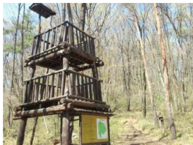
⑭ 再現した武田ののろし台