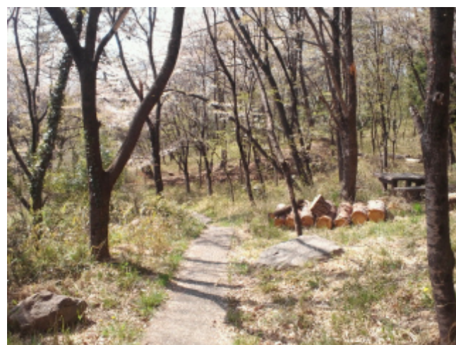
(22)地蔵古墳公園には2つの古墳があります