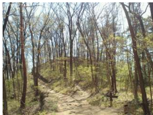
⑮ 湯村山城跡への道はのろし台の逆側です