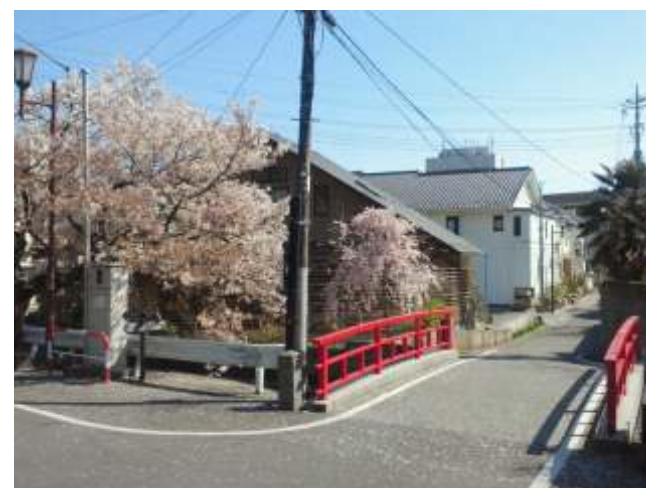
(27)延命橋をまっすぐ下っても戻れます