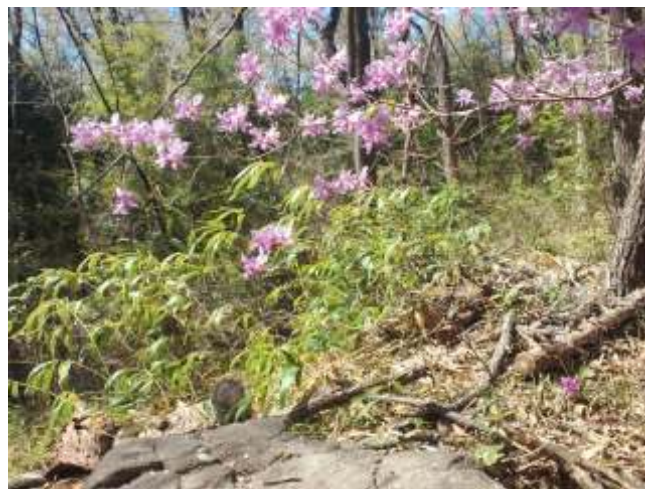
⑤ 湯谷神社裏手に続く遊歩道を進んで下さい