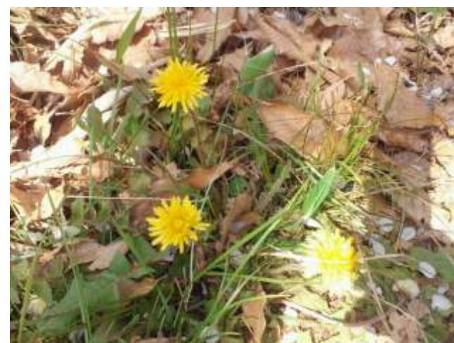
(23)休憩できるベンチがございます