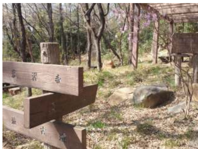
(21)帰りは下り坂ですのであわてずゆっくり