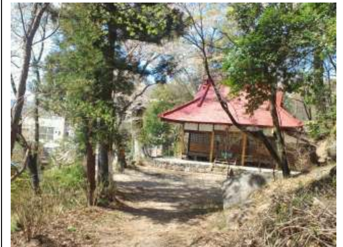
④ 森を抜けると湯谷神社が見えます