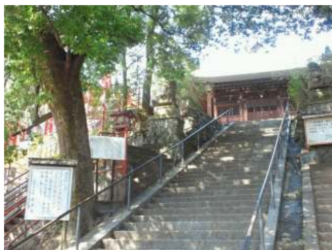
(25)塩澤寺の石段の上には地蔵堂があります