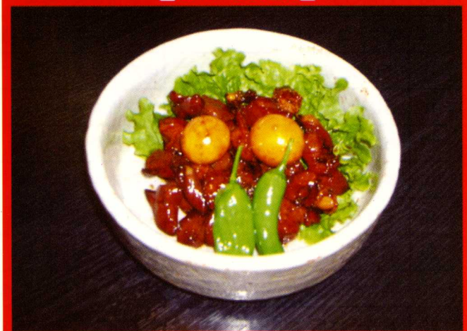
※ 写真はイメージです